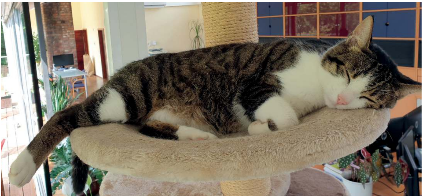
Schlaflos wegen dem Thema Kontaktmanagement? Nicht mit Act! von CRMADDON.

Mit Act!, einem der meistgenutzten CRM-Systeme der Welt, bleiben Sie ein großes Stück gelassener – eben so wie unser Harry.